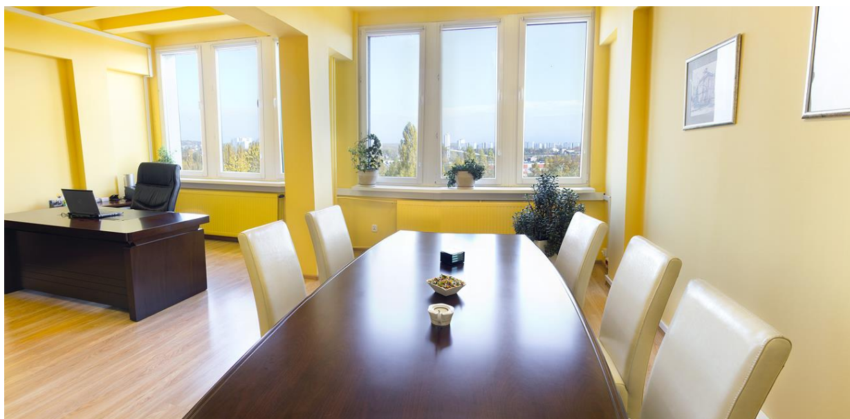
Przykładowa aranżacja pomieszczeń

ELKOP Spółka Europejska Kapitał zakładowy: 18.418.880,00 EUR w całości opłacony Sąd Rej. dla Łodzi Śródmieścia w Łodzi, XX Wyd. Gosp. KRS KRS 0000782225