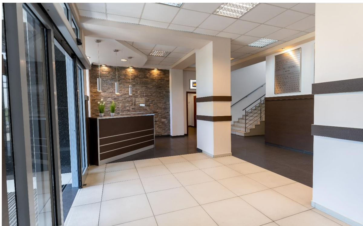
Hol główny i piętro